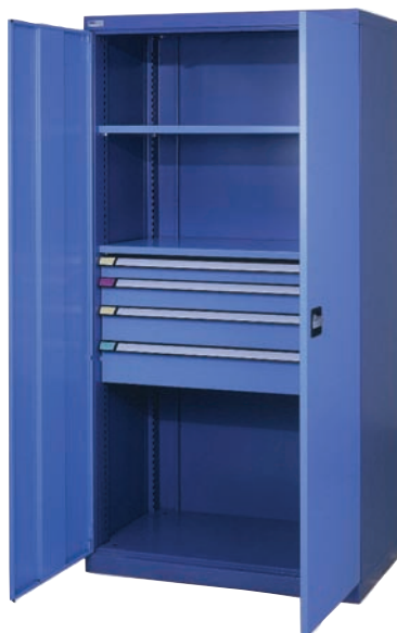
Schwerlastschrank mit 4 Schubladen und 2 Fachböden

4 Schubladen (1x75, 1x100, 1x125, 1x150) 2 Fachböden