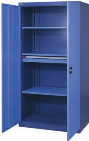
Schwerlastschrank mit 1 Schublade und 3 Fachböden