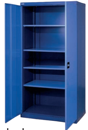
Schwerlastschrank mit 4 Fachböden