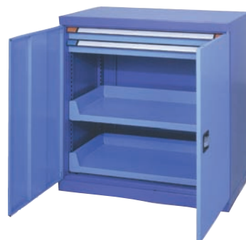
Schwerlastschrank mit 2 Schubladen und 2 Auszugsböden