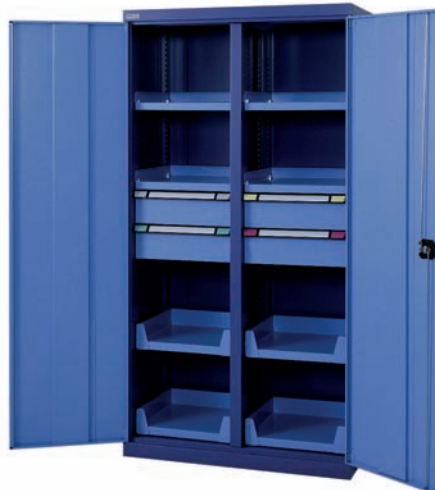
Schwerlastschrank mit 4 Schubladen, 4 Fachböden und 4 Auszugsböden

4 Schubladen H150, 4 Auszugsböden 4 Fachböden