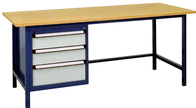
2 Schubladen H 150 mm, 1 Schublade H 200 mm