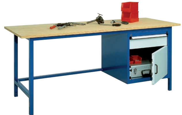
1 Schublade H 150 mm, 1 Tür H 350 mm