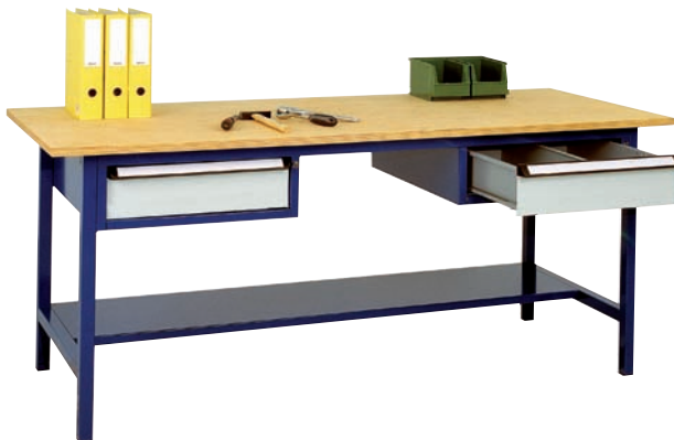
2 Schubladen H 150 mm, 1 Ablageboden T 400 mm