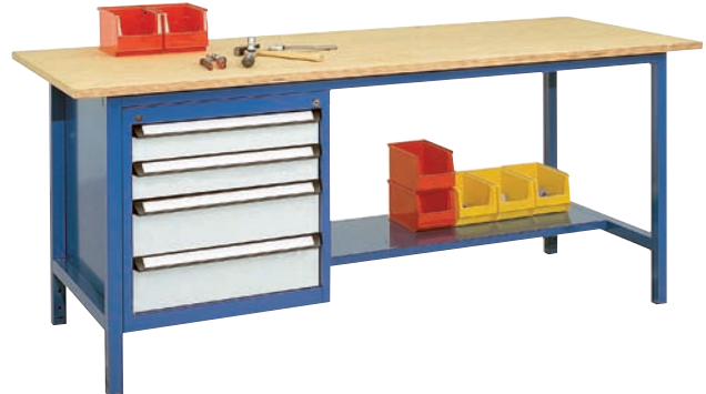
2 Schubladen H 100 mm, 2 Schubladen H 150 mm, 1 Ablageboden T 400 mm