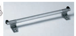
Abb.: LM-Rohr mit Halter mit Endrohanschlag rechts und links